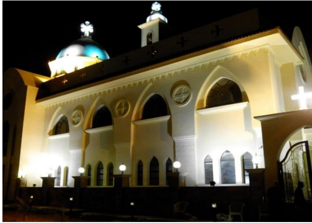
La Chiesa Cattolica “Madonna della Pace”