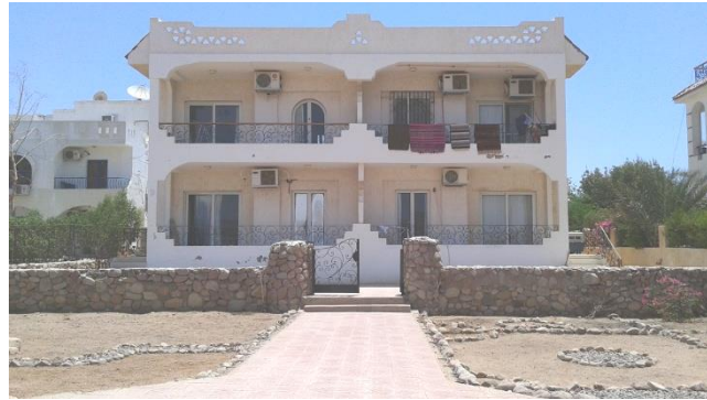
Il Centro di Accoglienza e Spiritualità Sharm El Sheikh

Per noi la Relazione tra ciò che possiamo “Essere” e l’Eucaristia è fondamentale ... E’ nel Dono che Dio ci partecipa di Se Stesso, che cresciamo in quel che in Lui possiamo Essere.