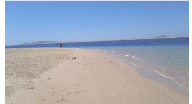
Attività del Centro

Coloro che vogliono approfondire la Spiritualità Eucaristica e/o divenire Adoratori Missionari dell’Unità nel formare, nel proprio luogo di residenza, una Comunità di Adoratori